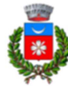
Comune di Massa Martana